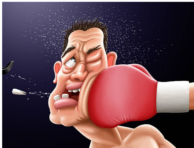
face Après combat (3 blessures),Faux sang, Prothèse,Fond de teint xx,Gélatine Raccords : J01 (202) 18/7