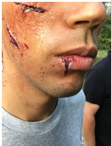
Profil droit Après combat (3 blessures),Faux sang, Prothèse,Fond de teint xx,Gélatine Raccords : J01 (202) 18/7